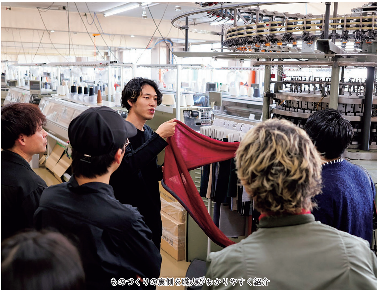
ものづくりの裏側を職人がわかりやすく紹介