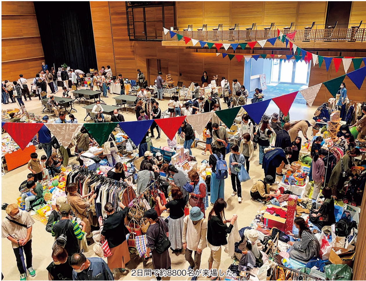
2日間で約8800名が来場した。