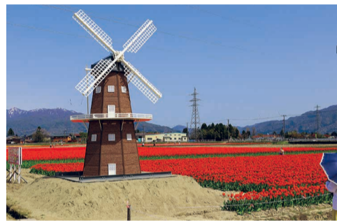
チューリップの抜き取り販売が実施された。

「第36回五泉市チューリップまつり」が4月15日から19日までの間、一本杉地内のチューリップ畑で開催された。3ヘクタールもの広さに約150万本のカラフルなチューリップが咲き誇り、花のじゅうたんを作り出した。また4月12日から13日、15日から16日には