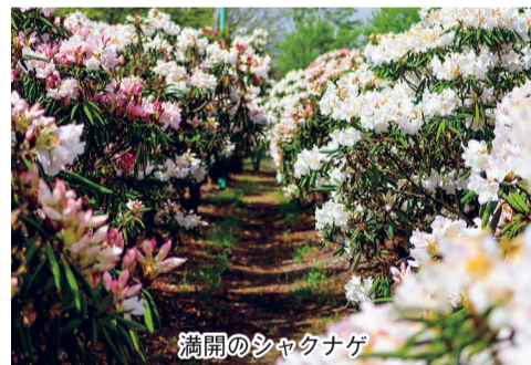
満開のシャクナゲ

り「の開会式が行われ、園内ではぼたんの鉢植え販売（4月29日より）、特産品や飲食物の販売（5月3日より）が計画されている。五泉市の花でもあ