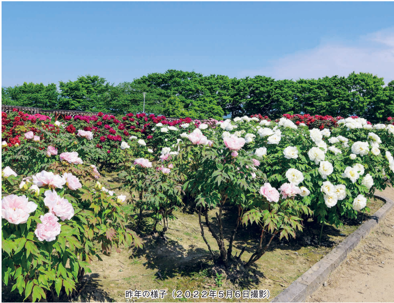
昨年の様子（2022年5月6日撮影）