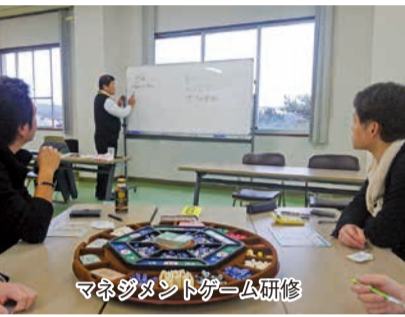
マネジメントゲーム研修

さて、女性会の活動といしましては、県内女性会合同研修会が五泉で開催され、会員の皆様の協力で大勢の方々にお越しいただき、無事に終わることが出来ました。今年も視察研修をはじめ、きなせやまつり、ごせん紅葉マラソンなど各イベントに協力してまいりたいと思っております。