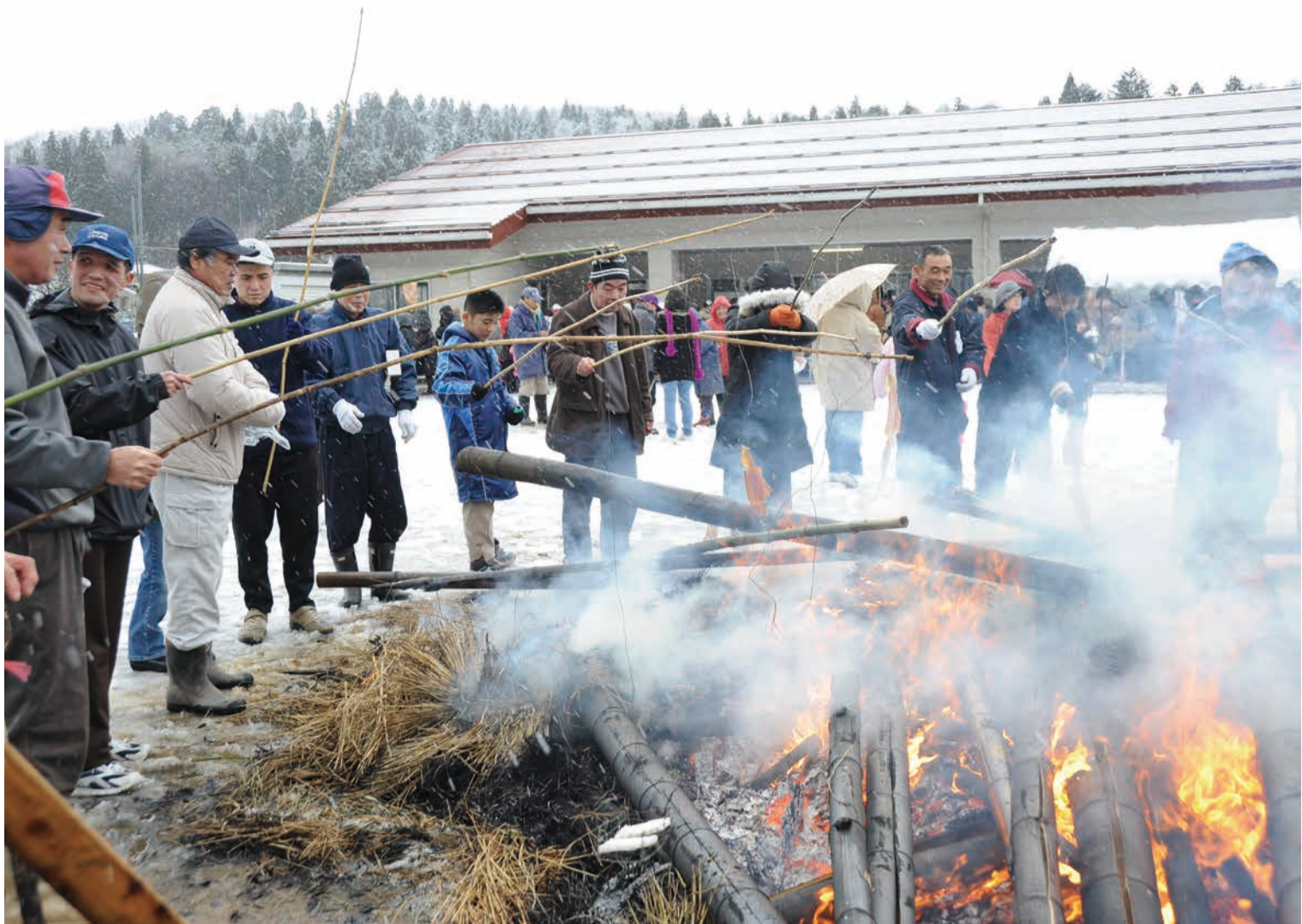
「今年1年の無病息災を祈願」（さいの神行事）