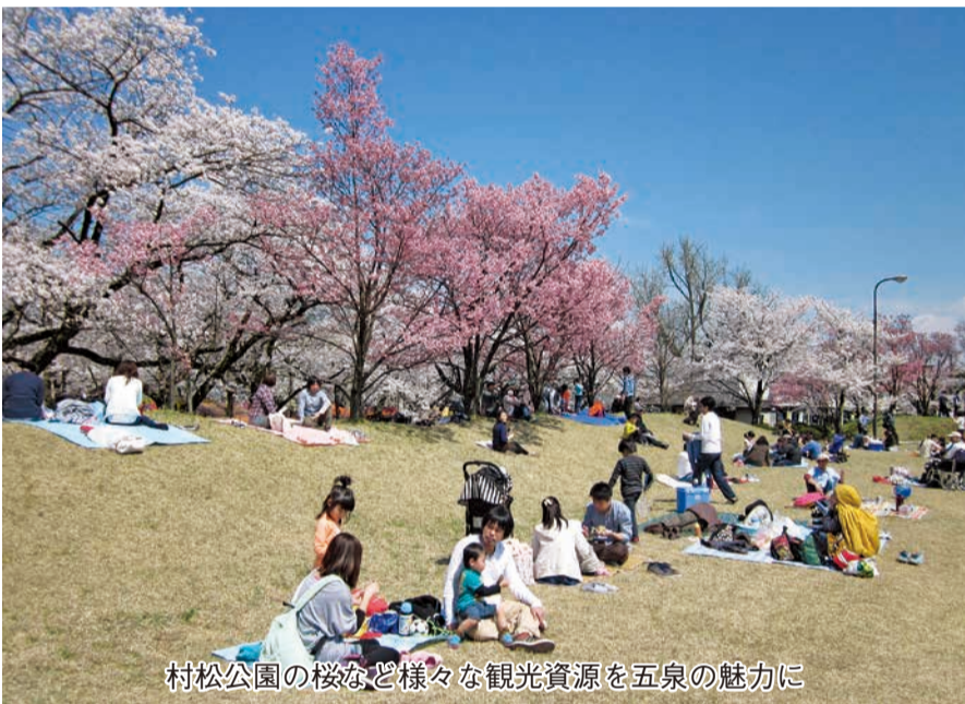
村松公園の桜など様々な観光資源を五泉の魅力に

また何と言っても、五泉市のニット産業は、やはりこの地区を代表する基幹産業です。こちらにも期待しています。先日あるニット会社の独自ブランドで開発