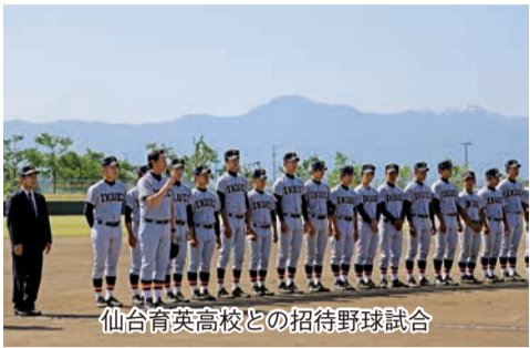
仙台育英高校との招待野球試合

こととなりました。両選手の活躍は特筆すべきものがあり、五泉市営野球場では共にホームランを放ち、投げて打って、その立ち居振る舞いもやはり超一流でした。今後の活躍を願ってやみません。今回の招待野球試合が地元高校野球部のレベルアップにつながればと思っております。