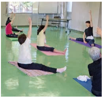
脳トレ&ストレッチ教室

5月25日に善光寺御開帳とあみだの里めぐりパークへの視察研修を実施。脳トレ&ストレッチ教室の開催