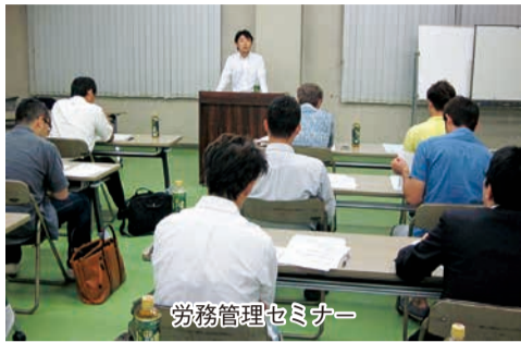
労務管理セミナー

続いて6月には経営者として知っておくべき労務管理セミナーを2回にわたり開催いたしました。8月にはきなせやまつり、大相撲